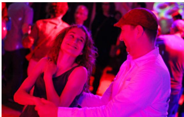
ZINNSCHMELZE Barmbeker Verein für Kultur und Arbeit Maurienstr.19, 22305 Hamburg Tel.-Nr.: 040 - 231 885 55

Stell dir vor, du betrittst die Zinnschmelze am 3. Samstag eines Monats. Die Lichter sind gedimmt, die Musik fängt an zu spielen und die Atmosphäre ist geladen mit Energie und Vorfreude. Es ist Zeit für die Salsa Night, das Ereignis, auf das du die ganze Woche gewartet hast.