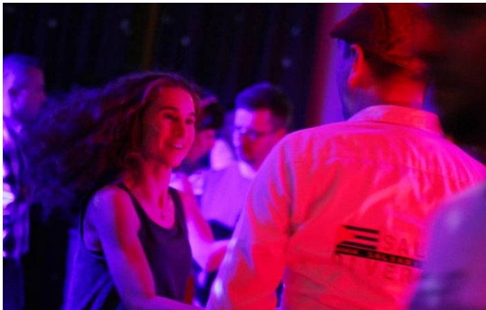
ZINNSCHMELZE Barmbeker Verein für Kultur und Arbeit Maurienstr.19, 22305 Hamburg Tel.-Nr.: 040 - 231 885 55

Die Mutter aller Salsa-Tanzveranstaltungen – mit Einführungstanzkurs